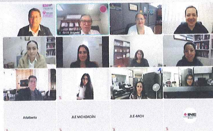
Reunión de trabajo, 7 de febrero de 2025

El 10 de febrero se llevó a cabo la firma del Plan de Trabajo en la JLE, en un acto celebrado ante los medios de comunicación. En representación del IEM, asistieron