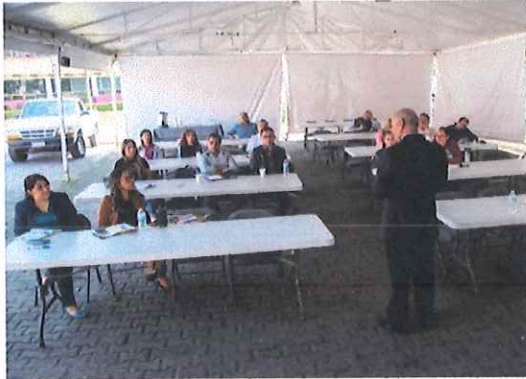
Sesión del 29 y 30 de octubre de 2024