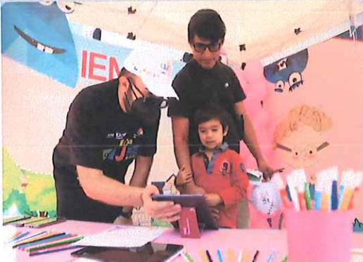
Inauguración de la casilla permanente del IEM