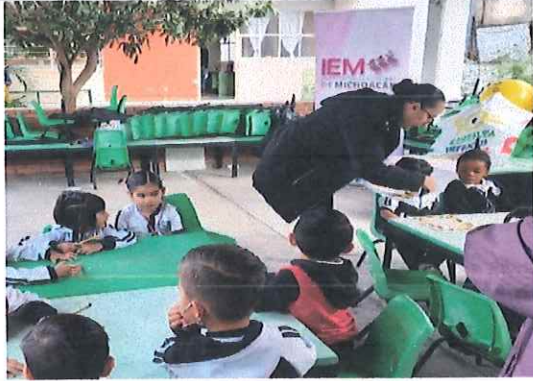
Preescolar "Juana Pavón", Morelia, Michoacán