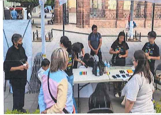
Secundaria Técnica 145, Morelia, Michoacán