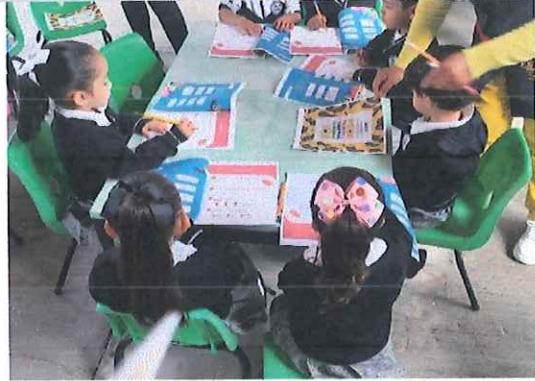
CEBETA 241, Irimbo, Michoacán