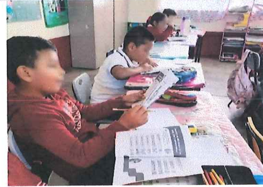
Primaria "José María Morelos", Tarimbaro, Michoacán