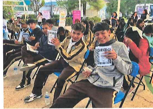
Primaria "Josefa O. de Domínguez", Cuitzeo, Michoacán