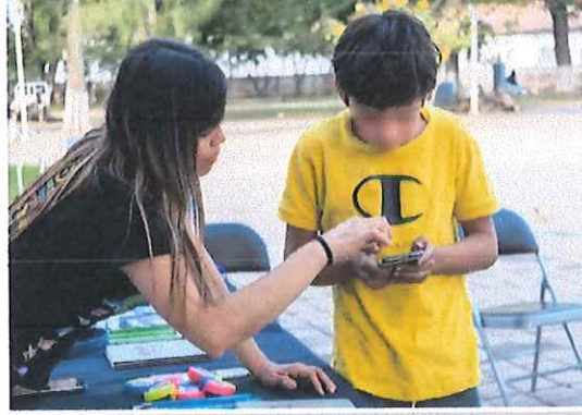
Plaza principal de Zamora, Michoacán