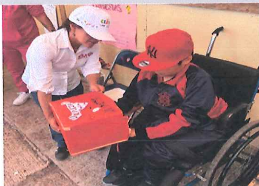
Escuela Secundaria Técnica No.168