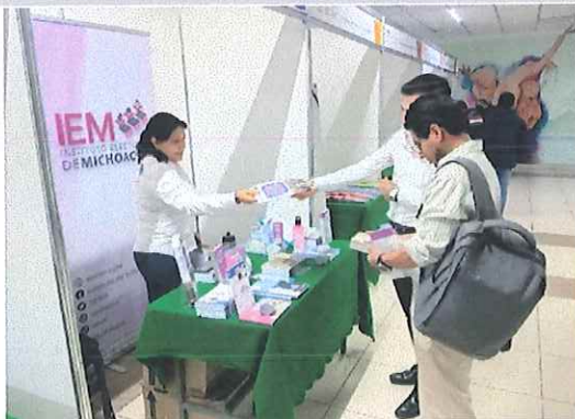
Estand de productos editoriales del IEM y material didáctico de educación cívica