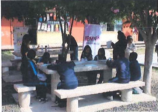
Secundaria Técnica 128, Morelia, Michoacán