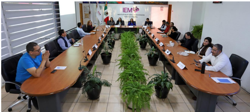
Reunión de Trabajo 21 de noviembre de 2023