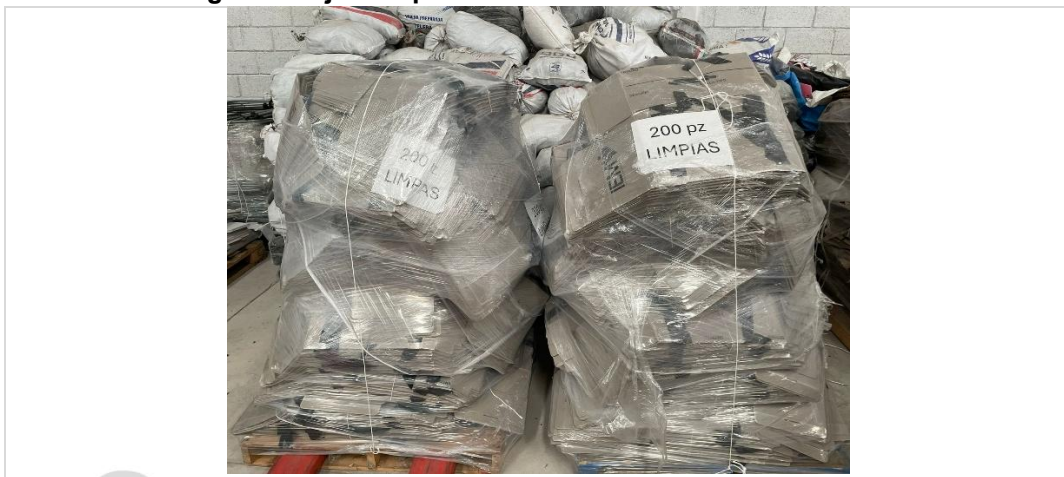
Imagen 5. Cajas Paquete Electoral color arena rehabilitadas

En lo correspondiente al avance en la rehabilitación de las cajas paquete electoral de color arena se informa que se lleva un avance de 400 cajas paquetes electoral rehabilitadas y quedan pendientes de aplicar los trabajos de rehabilitación a un total de 1,948, lo que representa un avance del 17 %.