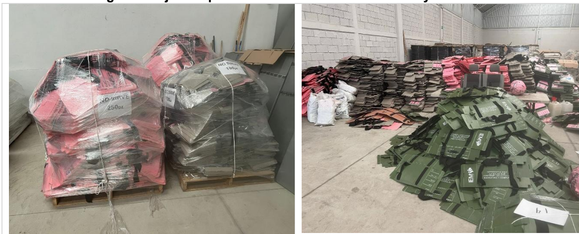
Imagen 1. Cajas Paquete Electoral color rosa en buen y mal estado