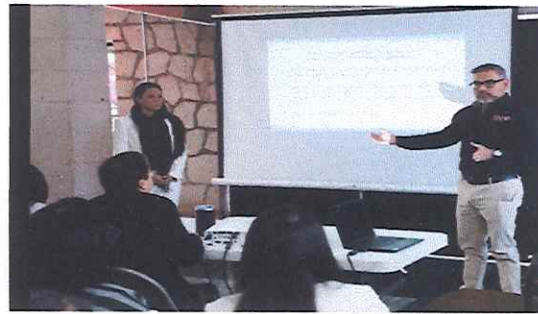
Capacitación en "ACCESO A LA INFORMACIÓN Y ATENCIÓN A SOLICITUDES CIUDADANAS" 18 de diciembre de 2025