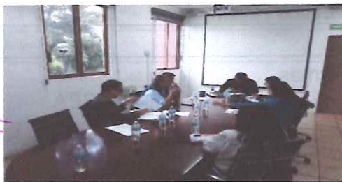
Reunión de Trabajo de Consejerías, Órgano Interno, Coordinación de Transparencia y Presidencia. 4 de septiembre de 2025