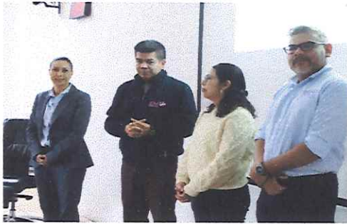
Capacitación en "ACCESO A LA INFORMACIÓN Y ATENCIÓN A SOLICITUDES CIUDADANAS" 11 de diciembre de 2025