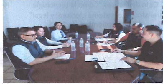
Reunión de la coordinación de Transparencia y el OIC trabajan en el análisis de las nuevas tareas de transparencia y protección de datos 17 de octubre de 2025