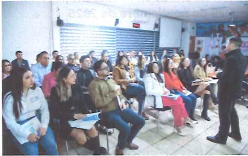
Taller de la Metodología para la Gestión de Riesgos de Corrupción, impartido por la SESEA 5 de noviembre de 2025