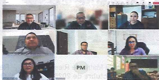
Reunión de las Coordinaciones de Transparencia e Informática sobre desarrollo de Chatbot 26 de septiembre de 2025