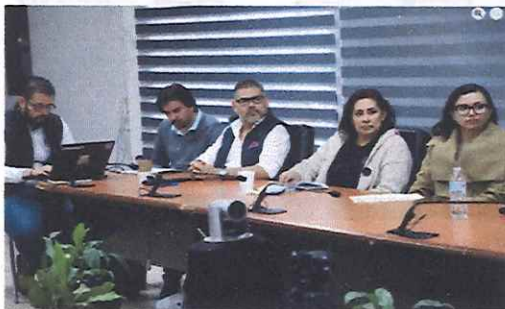
Reunión de Trabajo Junta Ampliada 6 de octubre de 2025