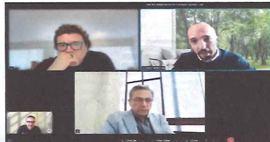
Reunión de trabajo entre el INE y los OPLEs, sobre la función de la Autoridad Garante de los Partidos Políticos Locales en materia de Transparencia 14 de noviembre de 2025