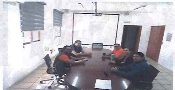
Conferencia virtual "Reforma Constitucional en Materia de Transparencia y Acceso a la Información Pública" 29 de septiembre de 2025