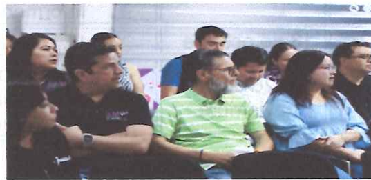
Acciones refuerzan la cultura de la prevención garantizando espacios de trabajo más preparados y seguros 5 de septiembre de 2025