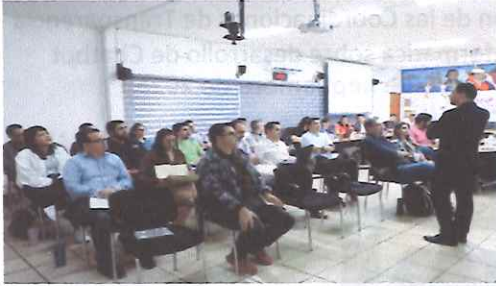
Elaboración de la Matriz de Riesgos 2026 14 de octubre de 2025