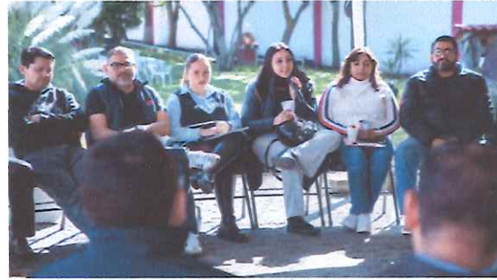
Sesión de "mi compromiso naranja" 6 de noviembre de 2025