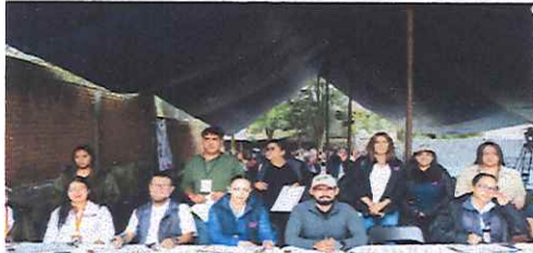
Ciclo de Platicas "Cómo la tecnología transforma el sistema electoral y legal" 22 de septiembre de 2025