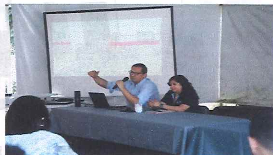
La incorporación de tecnologías contribuye a mejorar la productividad, reducir la duplicidad documental y optimizar los plazos de atención SAGIEM 13 de octubre de 2025