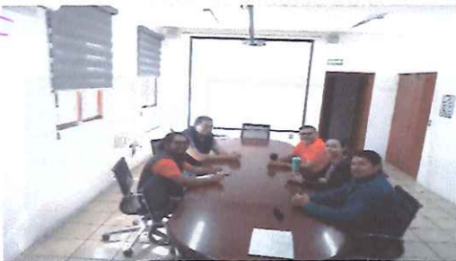
Reunión de las Coordinaciones de Transparencia e Informática sobre el avance de CV para los Servidores Públicos del IEM 13 de noviembre de 2025