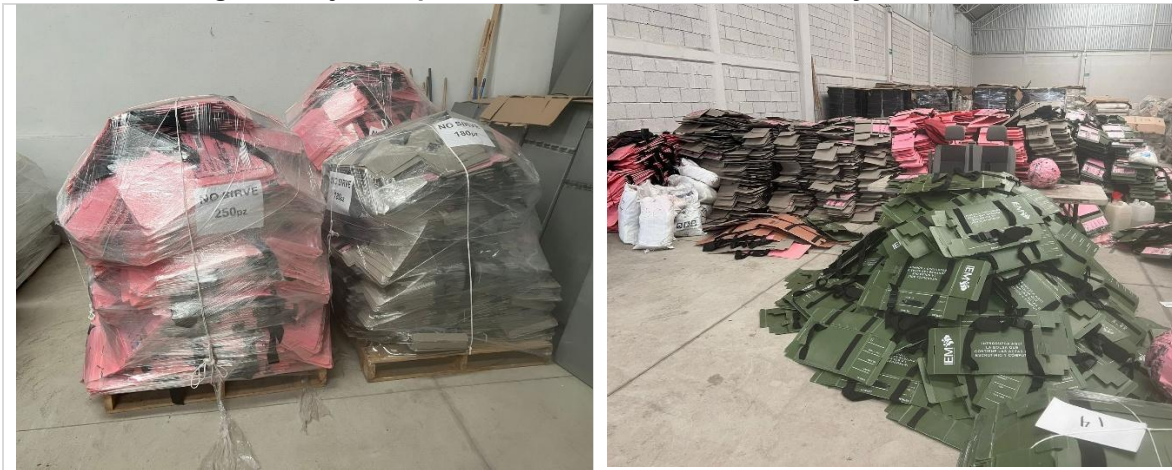
Imagen 1. Cajas Paquete Electoral color rosa en buen y mal estado