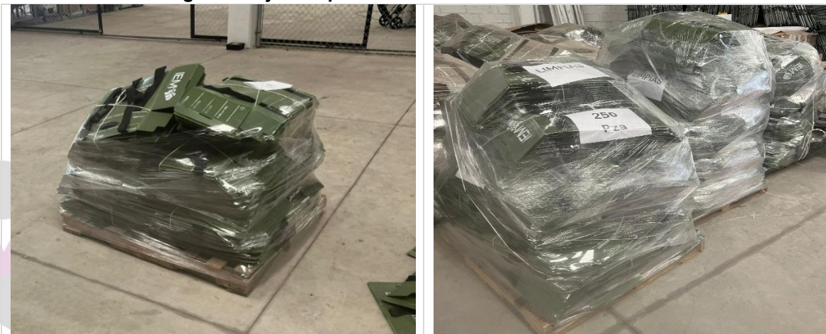
Imagen 3. Cajas Paquete Electoral color verde rehabilitadas